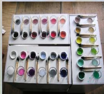
Jeu de peindre

Comme un enfant qui peint un enfant qui joue un enfant qui rit